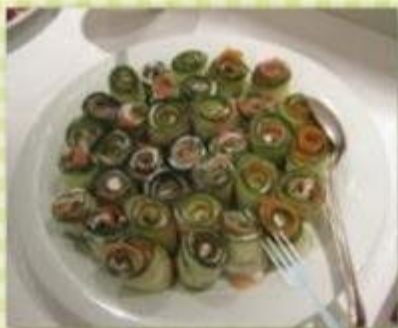
Lachs-Gurken-Röllchen mit Boursinmousse