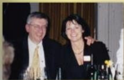
Young Swiss Design 2002 mit Club Luzern