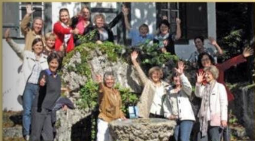
Besuch Club Vaduz, 5.9.2009. Höllgrottenbesuch mit Märchen und Sagen. Mittagessen im Rest. Höllgrotten