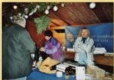
Märlisuntig Zug 2003