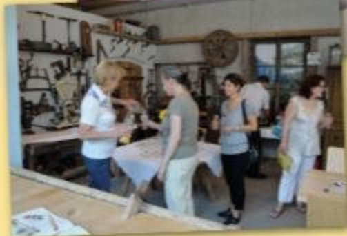
Ausflug zu Club Vaduz am 21.8.2010