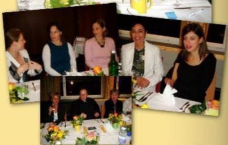
NewTree Burkina Faso (Franziska Kaguembèga-Müller), Wasserleitung Sikkim, Indien (Nina Hottinger), Wasserleitung für einen Bergbauer in Springen (Pfarrer Victor Hürlimann)