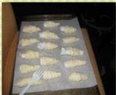
Pizza-Cornetti mit Ricotta- Pomodorisecchi- Füllung