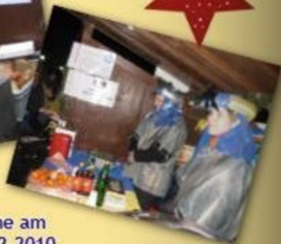
Traditionelle Teilnahme am Märlisunntig in Zug 5.12.2010