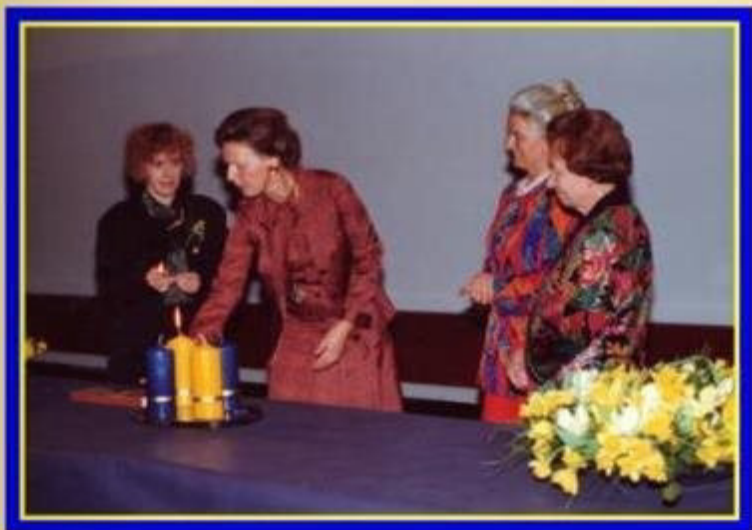
Charterfeier Soroptimist International Club Zug, 6. März 1993