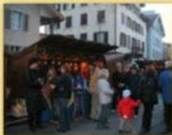
Christkindlimärt Baar 2004 - Verkauf von Käse aus Spirigen und Guetzli von den Grünau Kindern