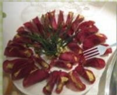
Mostbröckli gefüllt mit Safran Cashew und Wasabi-Nüsse