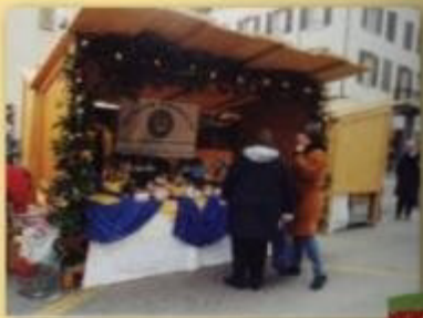
Christkindlimärt Baar 2000