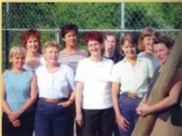
Spirigen - neuer Spielplatz