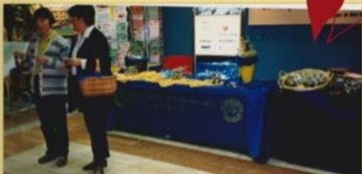
Verkauf im Einkaufszentrum Zugerland von Schoggi Sämichläusli und Herzen am 21.11.1997