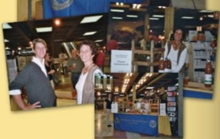
Verkauf von Süssmost im Einkaufszentrum Zugerland am 6.9.2003