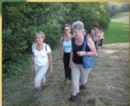
Sommermeeting am 8.7.2010 in Sihlmättli mit kleiner Wanderung in der Gegend