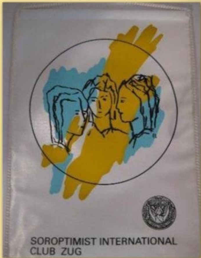
Die Fahne vom Club Zug "Begegnung"

"Ausgehend von der einzelnen Frauengestalt im Signet von Soroptimist International habe ich in dieser Zeichnung eine Frauengruppe dargestellt. Die drei in ihrem Wesen unterschiedlichen Frauen sind miteinander im Gespräch, hören einander zu, gehen aufeinander ein." Ester Löffel, Zug, 1992