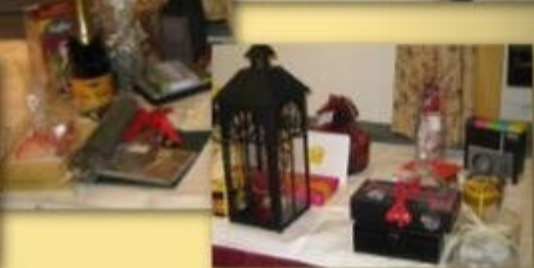
Lottomatch 10.11.2011 mit vielen tollen Prämien