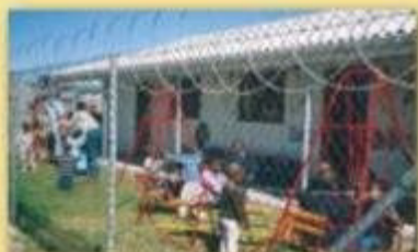
Mit Fatima Tschoop