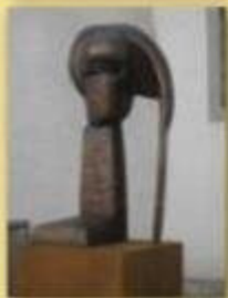
Besuch beim Club Vaduz 8.9.2012 Tour der Ausstellung Bad RagARTz