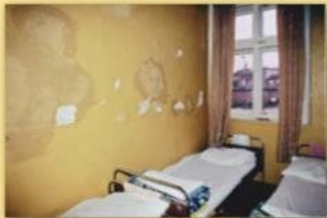
Schlafsäle im Waisenhaus in Burgas vorher/nachher