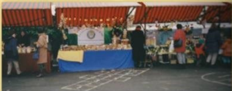
Christkindlimärt in Baar 6.12.1997 Verkauf von Bären, Samichläusli, Schoggi-Herzen und Konfitüre