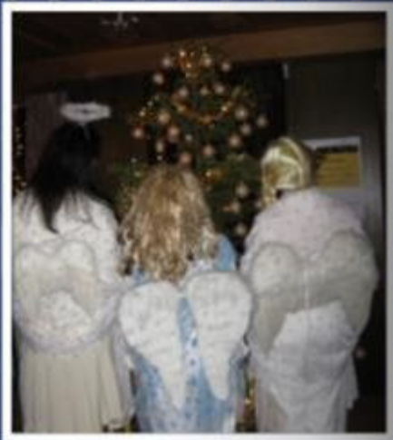
Das Sorop-Jahr vorgetragen von 3 Club-Engeln