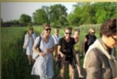
Exkursion Kloster und Naturschutzgebiet Frauental mit Apéro vom Rest. Guggital, 10.6.2010