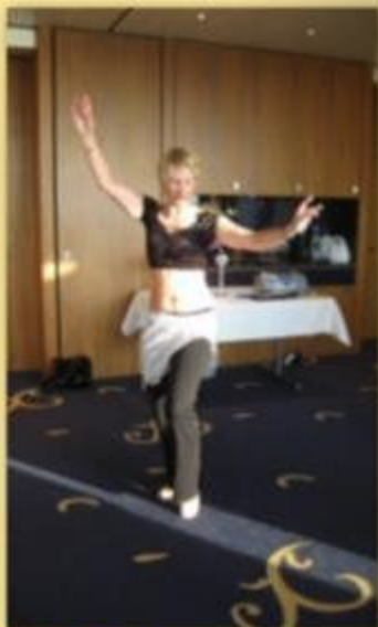
Bauchtanz 18.6.2009 Aller Anfang ist schwer!!