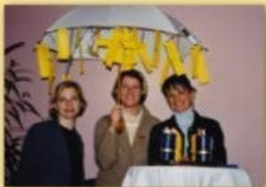
Aufnahme Irthe 2002