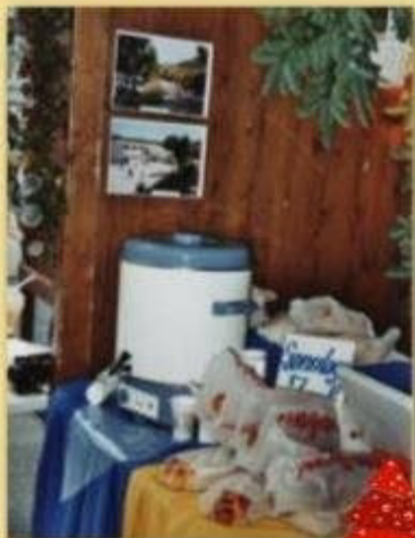
Christkindlimärt Baar 2003