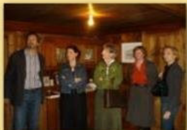
Besuch beim Club Vaduz 1.3.2008 Mittagessen, Besuch Kuefermartishuus, Käsedegustation