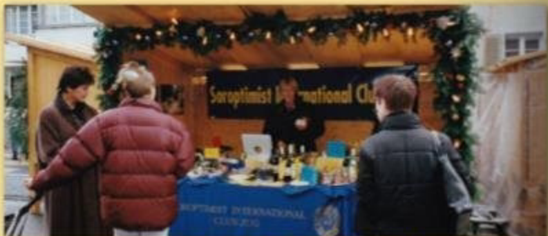
Christkindlimärt Baar 2001