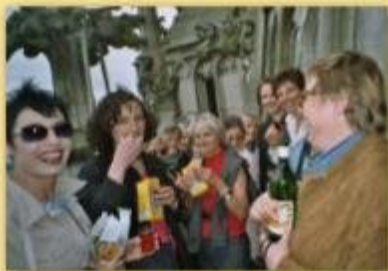
Ausflug nach Bern am 10. Mai 2003 anlässlich unseres 10 jährigen Jubiläums