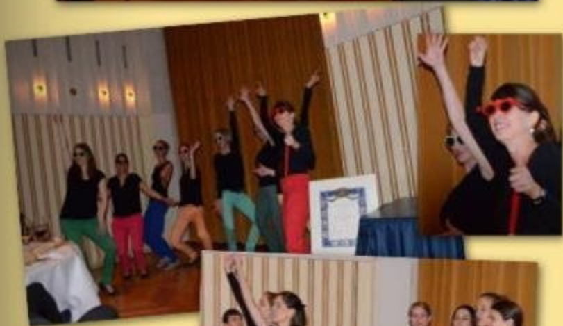
Die singing ladies "Tonique"