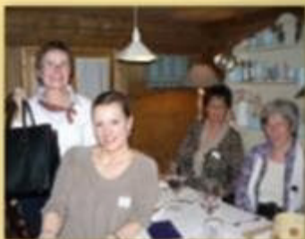
Innerschweizer Treffen im Rest. Tisch und Bar, Holzhäusern 6.5.2010