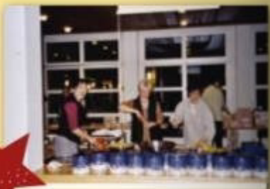
Verkauf von Alpkäse aus Spirigen und Guetzi