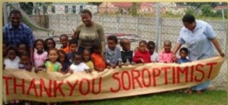
Projekt Sinobomi - Heim für aidsranke Kinder in Südafrika