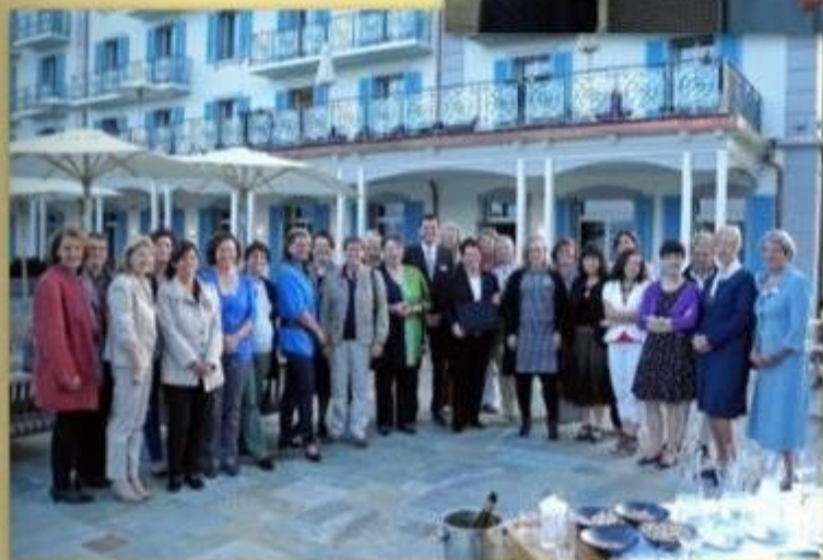
Scheckübergabe der Clubs Schwyz, Innerschweiz und Zug für das Unionsprojekt Microcredit in der Villa Honegg auf dem Bürgenstock, 6.9.2011