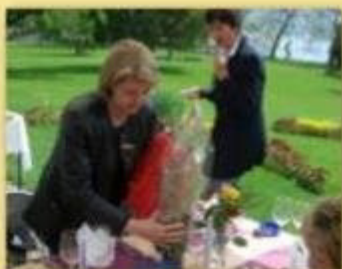
Besuch Club Vaduz in Zug 13.5.2006 Stadtführung, Schifffahrt, Mittagessen in Vilette