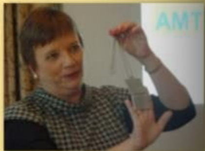
und Amtsübergabe 13.9.2012