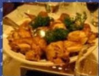
Weihnachtsmeeting im Rest. Blasenberg mit Champagner-Apéro und Kapaun 9.12.2010