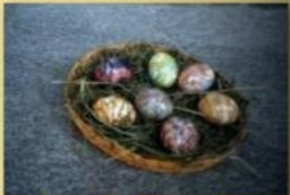
Färben und Verkauf von Ostereiern 2001 und 2002