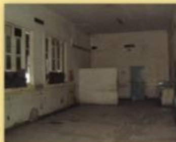
Renovation Geburtenklinik in Camaguey, Kuba - vorher