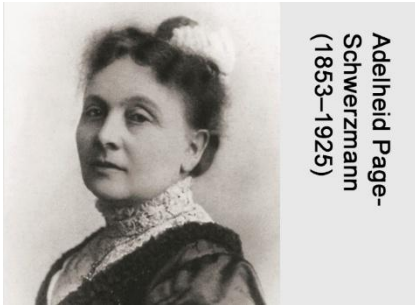
Adelheid Page- Schwerzmann (1853–1925)